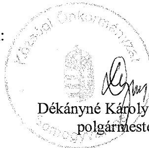
Dékányné Károly Marianna polgármester